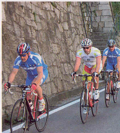
Rotariani in gara

partecipato e la portano sempre nel loro ricordo. Da allora ogni iniziativa diventa occasione di intensa attività sportiva e di contributo generoso. Molte sono infatti le attività promosse e la più recente si è svolta in occasione del passaggio dell'ultima edizione del Giro d'Italia nelle province di Novara e del Verbano Cusio Ossola lo scorso mese di maggio. "Con Noi al giro d'Italia" è stato il primo raduno di ciclisti iscritti alla fellowship ed ha promosso un intenso programma di tre giorni: venerdì 27 maggio al Motarone per seguire il passaggio della carovana sulle strade borromeo; sabato 28 maggio in Valsusa per applaudire "gli scalatori" in cima al Colle delle Finestre, e domenica 29 maggio lungo i tra laghi - d'Orta, Mergozzo e Maggiore - per un panoramico tour accompagnato da una meravigliosa giornata di sole. Una cena di gala sul Lago d'Orta, organizzata sul battello Ortensia riservato appositamente per l'occasione, ha salutato l'arrivo di tanti amici che, entusiasti, non hanno rinunciato ad alcuna delle tappe proposte. Si è trattato di un ottimo allenamento per il mondiale che si è tenuto in Svizzera, ad Aubonne, organizzato proprio dal locale Rotary Club. Tutti i rotariani appassionati di ciclismo potranno informarsi sulla fellowship visitando il sito www.cyclingtoserve.ch .